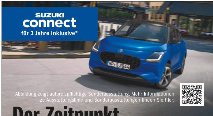
Abbildung zeigt aufpreispflichtige Sonderausstattung. Mehr Informationen zu Ausstattungslinie und Sonderausstattungen finden Sie hier: