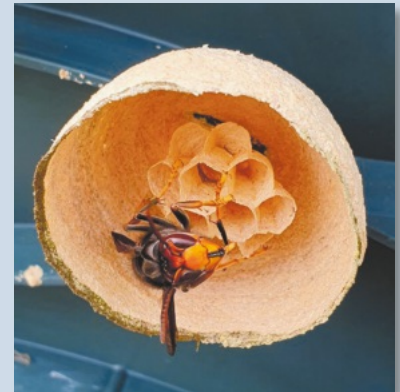
Embryonalnest nur mit Königin (März - Mai)