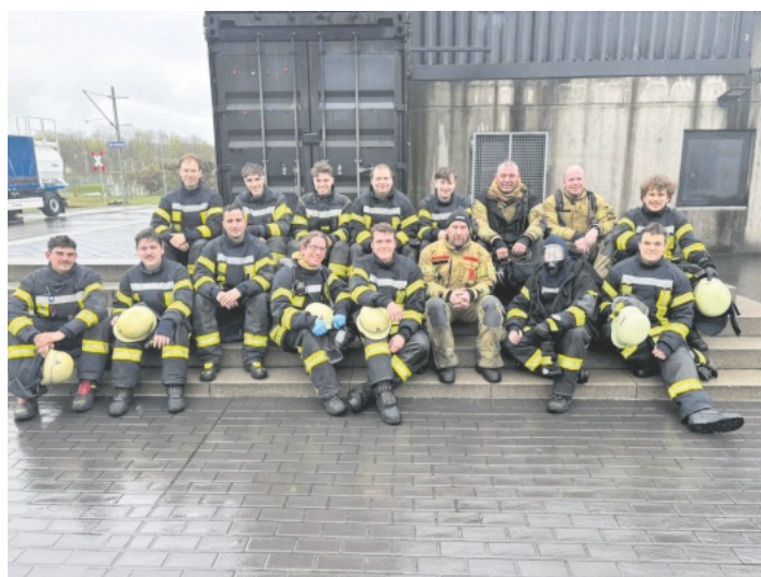
Teilnehmende Kameraden der Feuerwehr Seelbach zusammen mit den Feuerwehrkameraden der Feuerwehr Staufen nach der Abschlussübung

Am 14.03.26 nahmen 7 Kameraden der Feuerwehr Seelbach an einer Atemschutzweiterbildung unter sogenannten „Heißbedingungen“ in regionalen Feuerwehrübungsanlage In Eschbach teil. Mit dabei waren auch Kameraden der Feuerwehr Staufen.