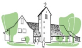
Evang. Kirchengemeinde Seelbach